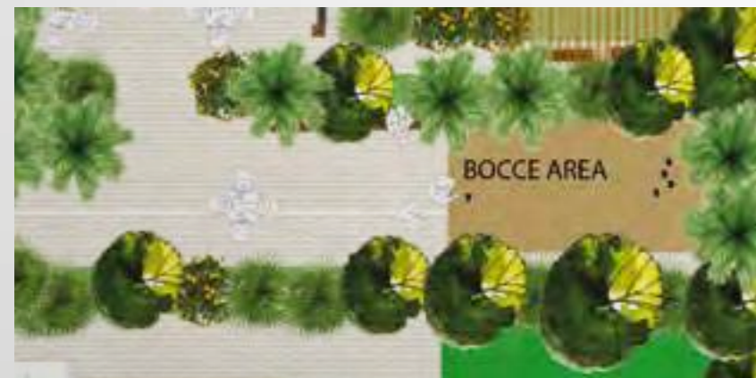
Extracted from the concept design idea

Bocce is loved by people of all ages. Competitors or teams lob a total of eight bocce balls as close as possible to a smaller white ball called the 'pallino.' It is estimated that the game originated in 5200 B.C. It is still played today all over the world - the second most played ball sport behind soccer. Azizi Riviera is the best place to play bocce in the Meydan area.