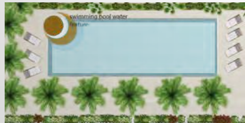
Extracted from the concept design idea

Sitting lazily next to the beautiful pool and sipping away at your favourite beverage is one of the first images that comes to mind when one thinks about lovely holidays. Swimming pools have become synonymous with relaxation and rejuvenation. This is one of the obvious reasons why they are increasingly becoming an integral part of stylish modern homes. Azizi Riviera will take this amazing outdoor experience a notch higher with a stunning waterfall feature that promises to take your breath away.