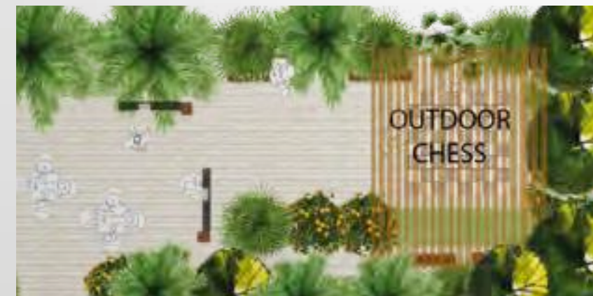
Extracted from the concept design idea

A timeless game enjoyed by all generations. You don't need backyards or large patios, the possibilities are endless at Azizi Riviera.