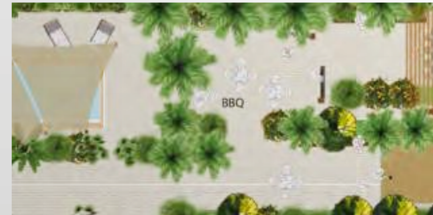
Extracted from the concept design idea

Live the ultimate lifestyle in Dubai. High up on your own rooftop terrace, you are easily able to entertain guests or relax alone on a sun-lounger, it is the finest way to live.