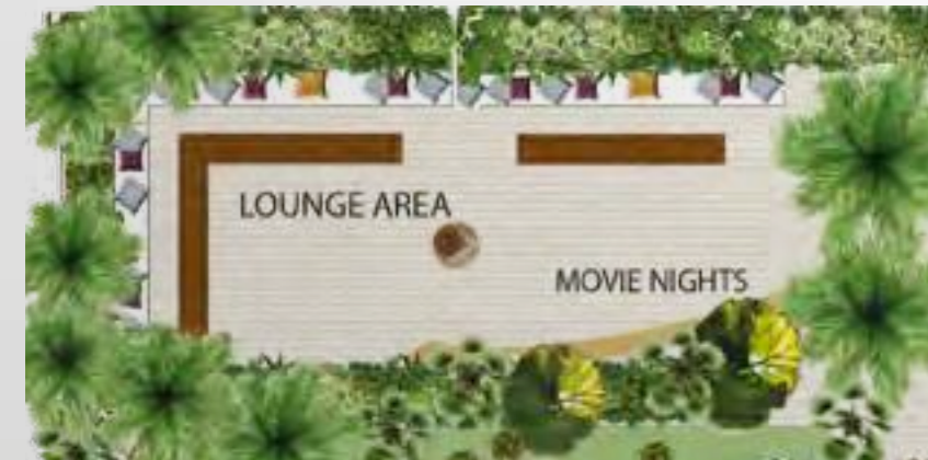
Extracted from the concept design idea

Upgrade the usual stay in movie night experience to a night under the stars at Azizi Riviera. Enjoy your favorite movies with family and friends outdoors in the fresh air.