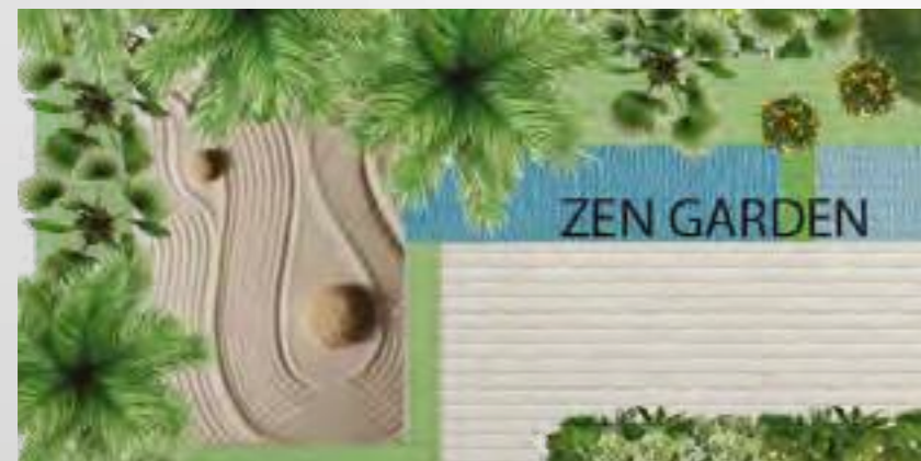
Extracted from the concept design idea

The sand or gravel in a Zen garden represent the sea or ocean and is used instead of water. Azizi Riviera Zen garden is carefully designed by our designers to create the impression of waves on the surface of a body of water. The rocks themselves represent islands or rock formations jutting out from the water.