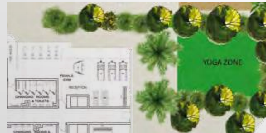
Extracted from the concept design idea

India may be the home of yoga, but right now Dubai is among the world's greatest hubs for this super-healthy practice. Of course it's not surprising that you can find so many different styles of yoga in Dubai, but the city has a reputation for diversity to uphold. There truly is something for everyone and anyone, even those who prefer to take outdoor fitness classes can try outdoor yoga at Azizi Riviera. It will change your life!