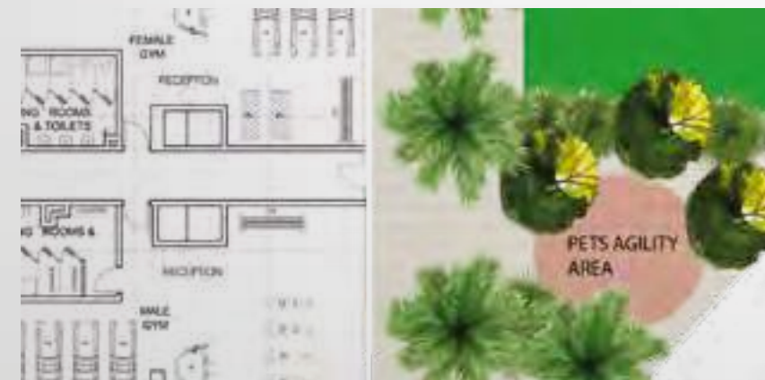
Extracted from the concept design idea

As every good pet owner could tell you, being a good companion is a two-way street. Pets give people a lot of affection and fun, but they need to be taken care of too. Since dogs need more than just food and sleep to stay healthy, finding ways to get them outside and active is so important. Our pet play area gives the animals the opportunities to exercise their growing minds and bodies outside.