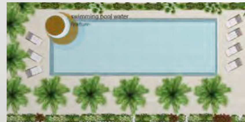
Extracted from the concept design idea

A large swimming pool to unwind with the whole family, plenty of space, an abundance of natural light and state of the art facility set the perfect stage for a tough workout, or an invigorating morning stretch.